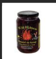
Tarro 50 Flores de Hibiscus en Almibar